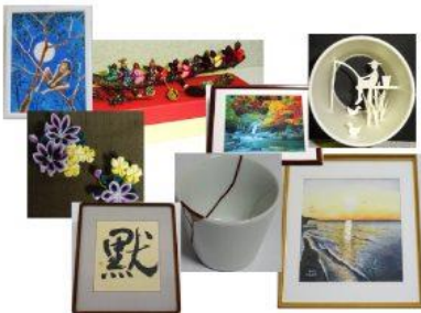
第35回 文化祭作品より

「入院・外来患者さんおよびご家族と職員とのコミュニケーションを図り、相互信頼を深めること」を目的とした『患者様と職員の文化祭』が、皆様のご協力のもと、今年で36回目を迎えることになりました。毎回、愛好家の方、地域住民の方、近隣の学生の方など多くの方々に、絵画・写真・手工芸・書などの作品を出品いただき厚くお礼申し上げます。今年は、10/21(日)から11/24(土)正午までの開催となります。